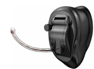
Abbildung des CIC (wireless) Im-Ohr-Hörsystems